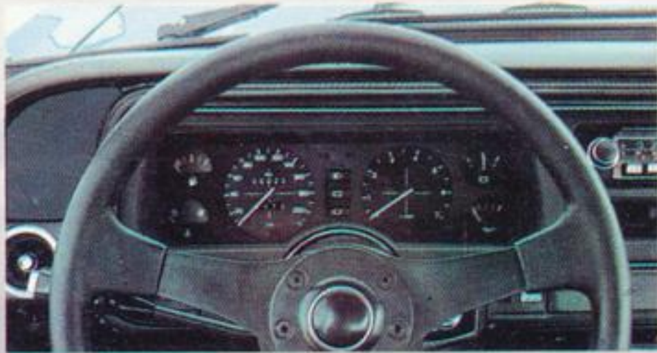
Lederbezogenes Sportlenkrad und Spezialinstrumentierung.

Dieser 6-Zylinder nimmt unter den renommierten Automobilen eine Position ein, die bisher unbesetzt war. Denn er verbindet aufwendige Automobiltechnik mit der größeren Freizügigkeit einer fünftürigen Limousine.