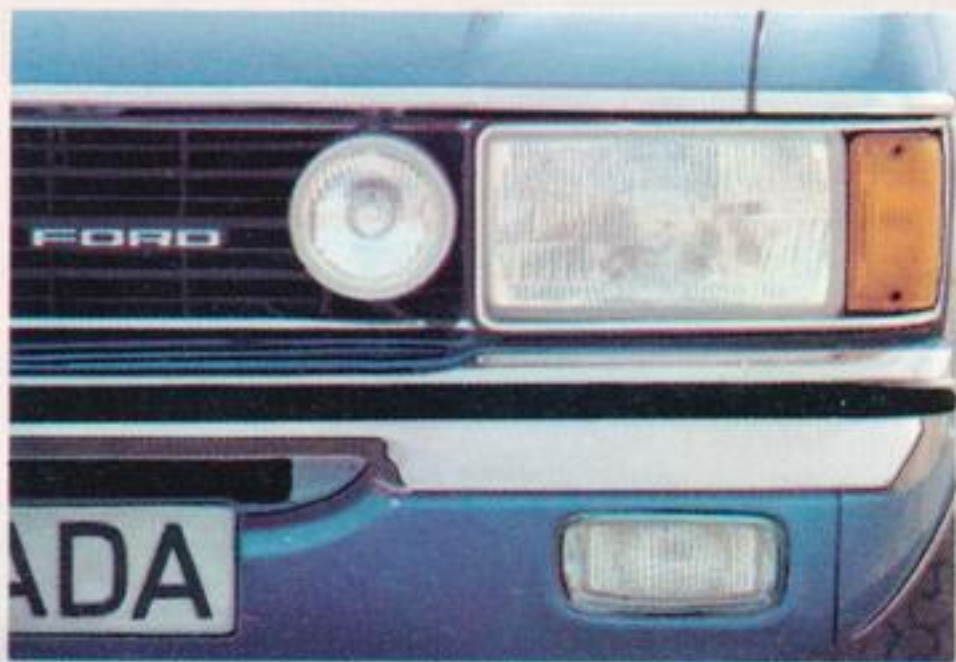
Halogen-Haupt-, Fern- und Nebelscheinwerfer.

Zusammen mit einem ausgeklügelten Schallschlucksystem ergibt das innen eine Atmosphäre gepflegter Ruhe. Die serienmäßige Servolenkung macht das nicht gerade kleine Auto sehr handlich und vermittelt sicheren Kontakt zur Straße.