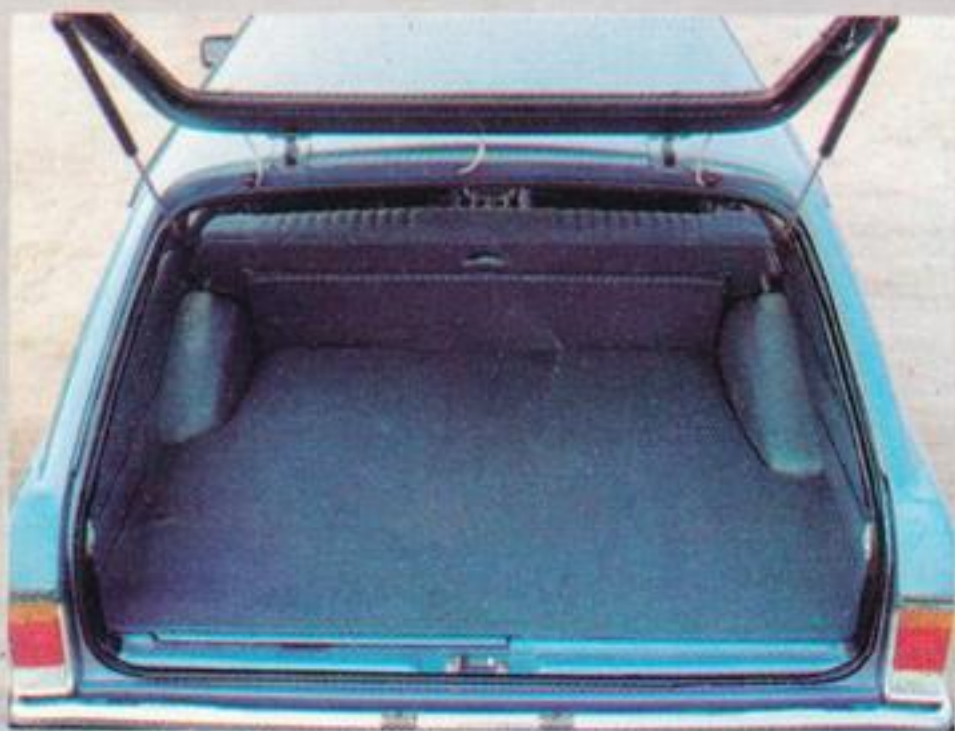
Fassungsvermögen: 1,18 m 3 . Mit umgeklappter Fondsitzbank: 2,18 m 3

Zusammen mit einem ausgeklügelten Schallschlucksystem ergibt das innen eine Atmosphäre gepflegter Ruhe. Die serienmäßige Servolenkung macht das nicht gerade kleine Auto sehr handlich und vermittelt sicheren Kontakt zur Straße.