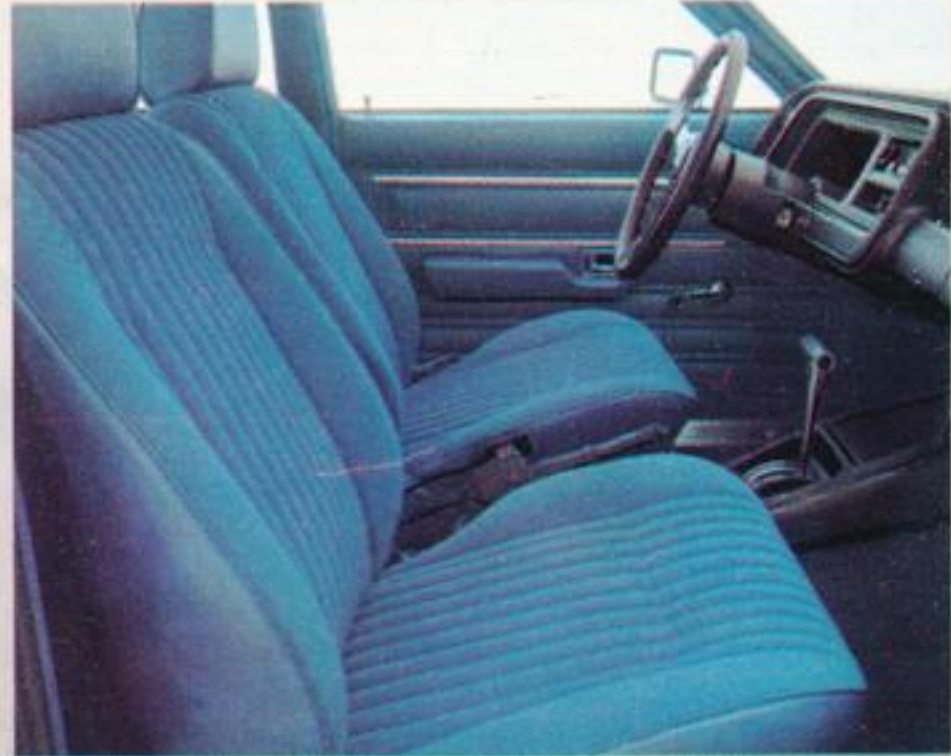
Einzelliegesitze mit höhenverstellbaren Kopfstützen.

chen sportliche Fahreigenschaften mit hohen Sicherheitsreserven und gleichzeitig einen erstaunlichen Fahrkomfort. Die großvolumigen V6-Triebwerke von Ford sind bekannt für geschmeidige Kraftentfaltung und dezente Akustik.